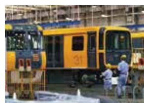
検査棟での新型車両の様子。安全と安心を運ぶための検査を実施する。

アストラムライン沿線マガジン Vol.8 2020 SUMMER (2020年6月15日発行) 【発行】広島高速交通(株) http://astramline.co.jp/ 【企画・編集・印刷】タウン情報 Wink 沿線マガジンの情報はWinkホームページ https://wink-jaken.com/ でもご覧いただけます。 ※本紙の制作業務は、(株)アスコナタウン情報ウイック編集部に委託しています。 ※本紙の掲載内容は、原則として2020年6月現在のものです。それぞれの店の情報が取材時とは異なっている場合がありますが、ご了承ください。