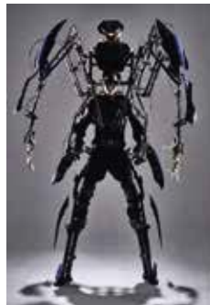
「スケルトニクス」