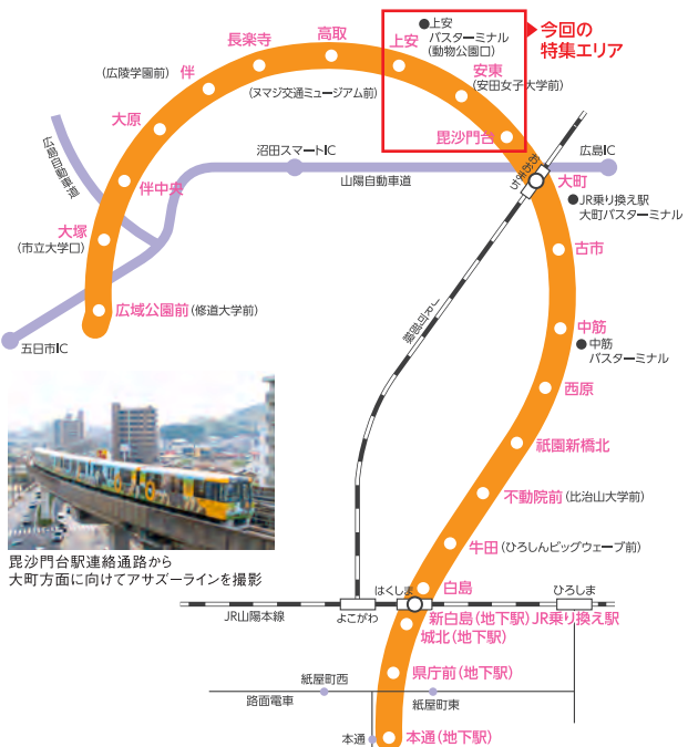
毘沙門台駅連絡通路から大町方面に向けてアサスラインを撮影

Information 2/9(土)、10(日) 開帳は9日12:00、14:00、16:00、20:00、22:00、24:00、10日4:00、10:00、12:00、14:00、16:00 権現山 毘沙門堂(安佐南区緑井) 電話 毘沙門通り商店街振興組合 082-870-5343